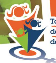
Table de concertation des groupes de femmes de Lanaudière